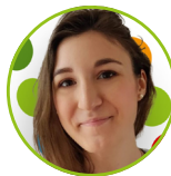
Charlotte Claveau Comunicazione